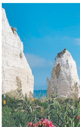
Il monolite di Vieste simbolo della leggenda sull'amore di Pizzomunno e la sua Cristalda